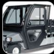
Barras Anti-vuelco y Cabina Certificadas