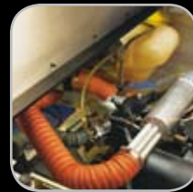
Calefacción en Cabina