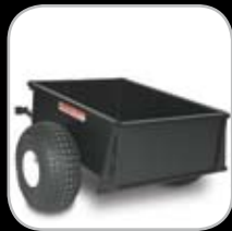
Carreta para Escombros