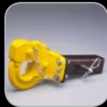
Enganche de Pinza