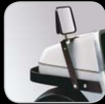
Parachoques de Trabajo Pesado/Retrovisor Costa Oeste