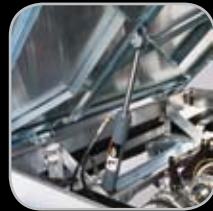
Plataforma de Carga con Elevación Eléctrica