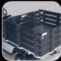
Remolque de Carga