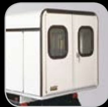
Van Box a Medida