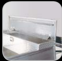
Caja para Herramientas