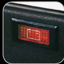
Indicador de Batería