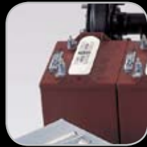
Baterías de Alta Resistencia