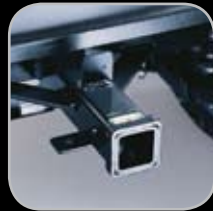
Porta Enganche Trasero de 50mm