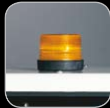
Luz de Gálibo