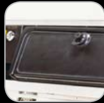
Guantera con Cerradura