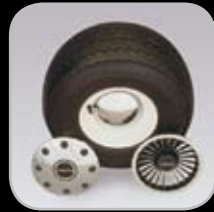
Cubierta de Neumáticos