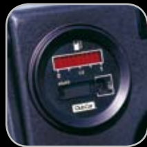
Indicador de Gasolina y Horímetro