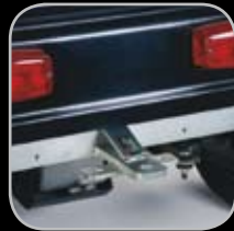
Bola de Enganche